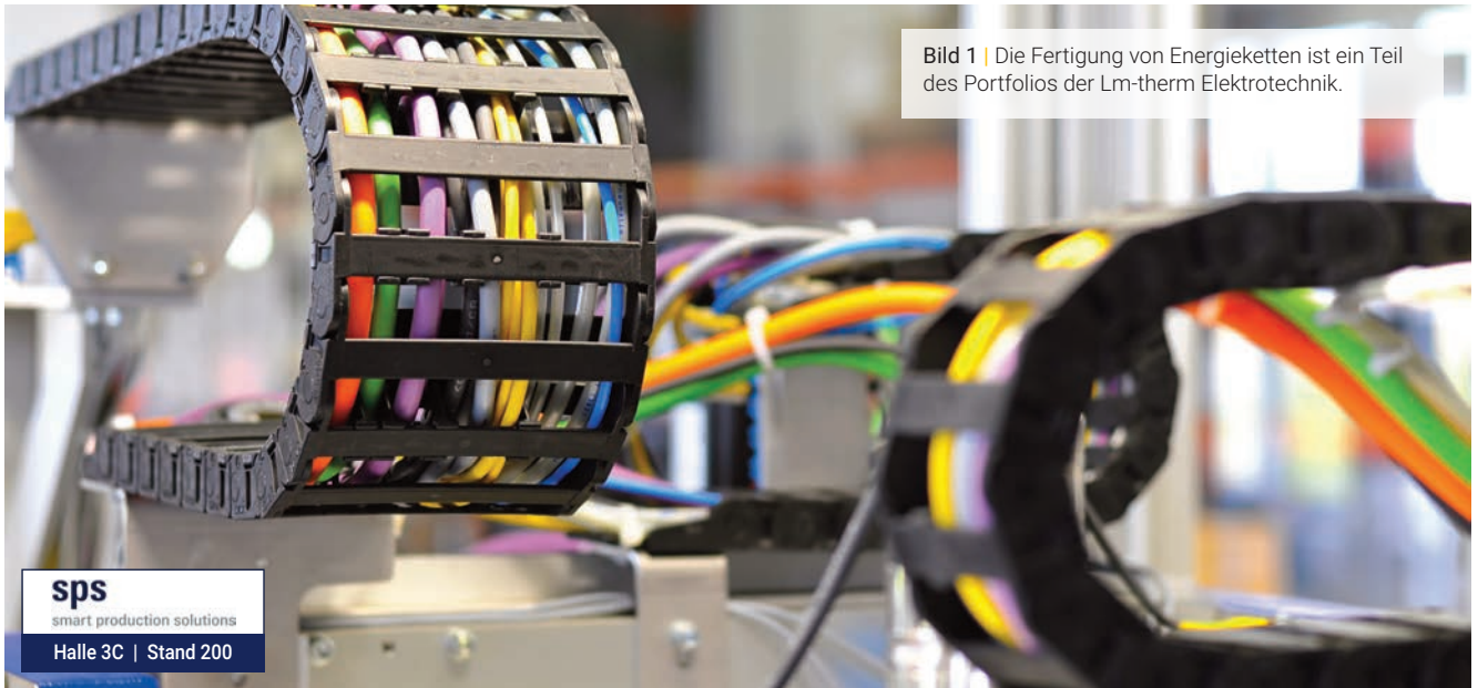
Bild 1 | Die Fertigung von Energieketten ist ein Teil des Portfolios der Lm-therm Elektrotechnik.

sps smart production solutions Halle 3C | Stand 200