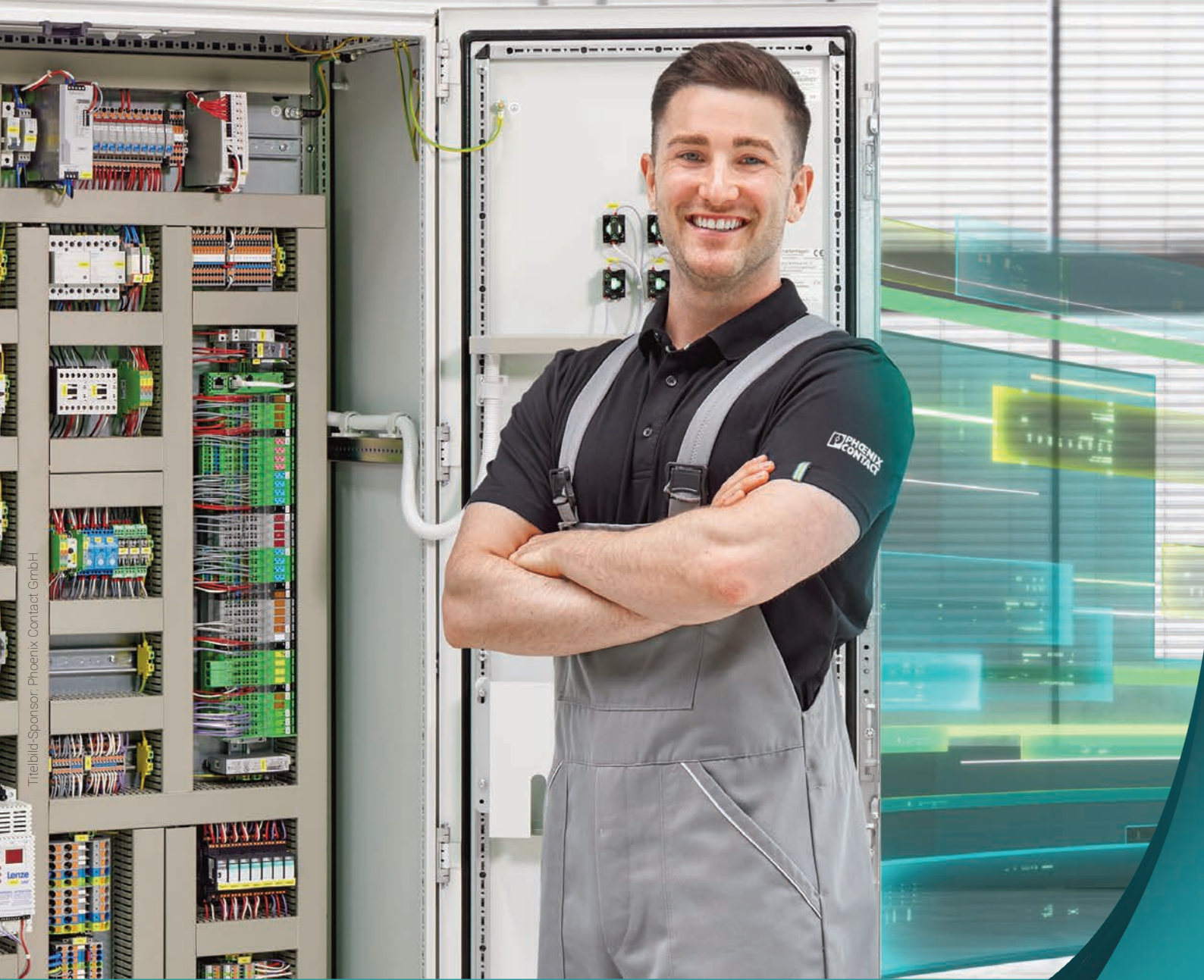
Titelbild-Sponsor: Phoenix Contact GmbH